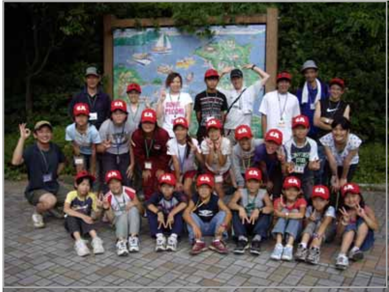
8 月子ども会上級ジュニアリーダー研修会