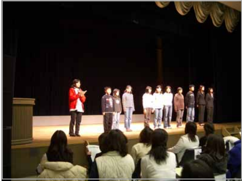
17 後期総会ジュニアリーダー活動発表